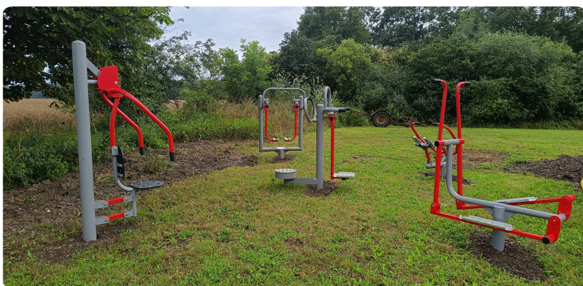
WORKOUTOVÉ HRŠTĚ VE ZVÍKOVĚ - BOHARYNĚ

MAS Hradecký venkov děkuje všem realizátorům za svědomitý přístup a těší se na další dokončené projekty v našem regionu.