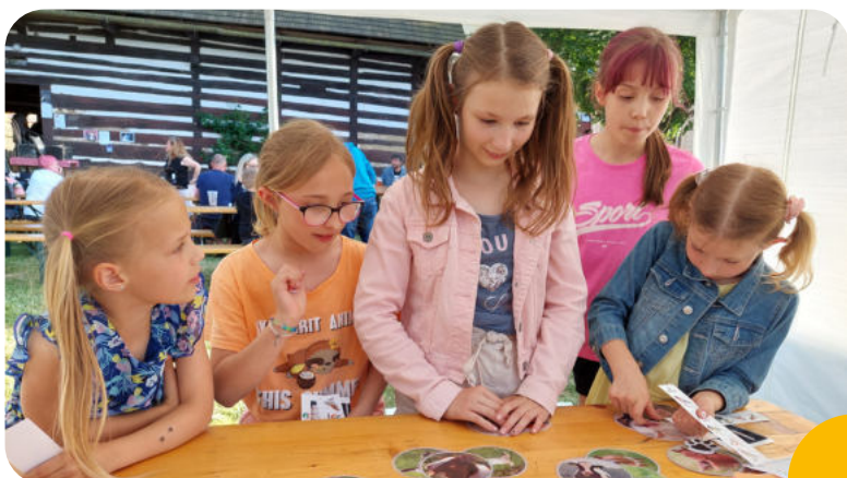
Muzejní noc 17. 6. 2023 - Hořiněves