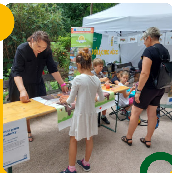
Festival Královéhradeckého kraje 23. 6. 2023