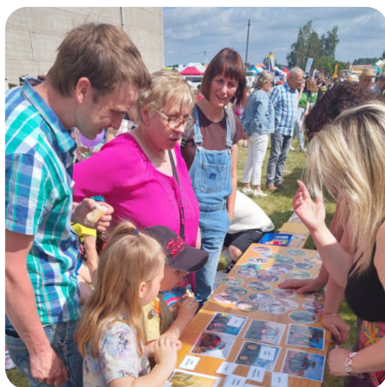
Zemědělský den Mžany - 2. 6. 2023 Sověstice