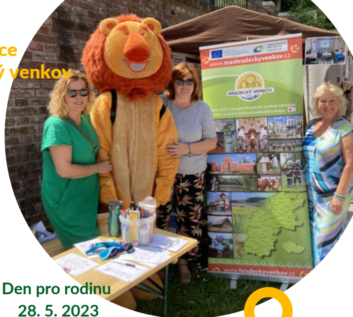
Den pro rodinu 28. 5. 2023 Hradec Králové

Děti sestavovaly včelku, poznaly, jak to chodí v úlu nebo stopovaly zvířata. S rodiči se zapojili i ti nejmenší, hodem na cíl nebo poznávačkou zvířecích rodinek.