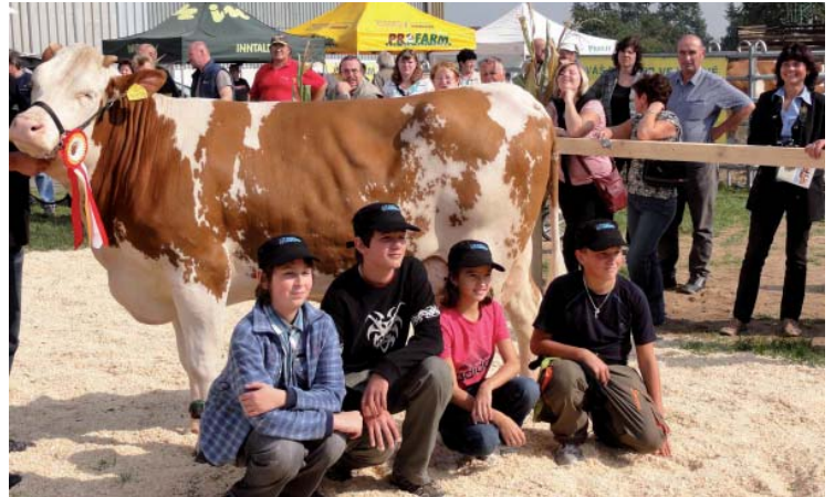
Žáci základní školy Karla IV., z MAS Společná CIDLINA, kteří se úspěšně účastnili hodnocení zvířat.