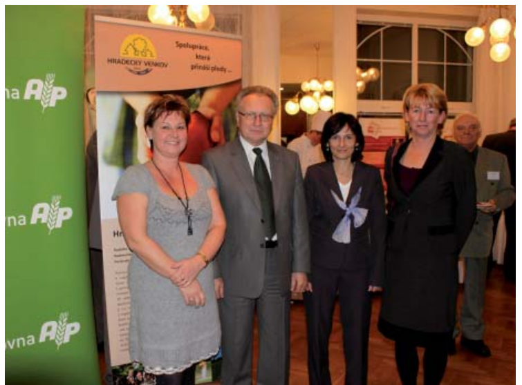
Prezentace MAS Hradecký venkov a metody Leader na fóru.

Z předchozího textu je zřejmé, že i rok 2011 byl pro o.p.s Hradecký venkov úspěšný. Kromě naší stěžejní činnosti, tj. realizace strategického plánu LEADER, podpory našich žadatelů v realizaci jejich projektových záměrů, bylo uskutečněno i několik dalších projektů, které zcela jistě přispěly k rozvoji našeho regionu a podpoře širokého spektra jejich obyvatel - žáků základních škol - nové interaktivní tabule, děti a mládež - nová dětská hřiště, podpora kulturního dědictví našeho venkova - pořádání různých kulturních společenských akcí vedoucích k prezentaci kulturního dědictví, podpora seniorů - pořádání kurzů, seminářů a zájezdů, podpora spolků a obcí - zapůjčení vybavení a techniky a další.