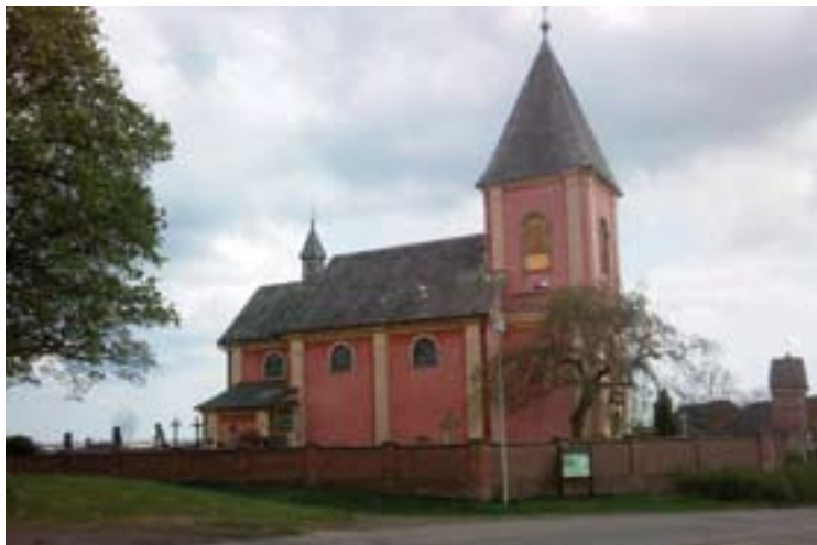
↑ Obec Hrádek - Oprava hřbitovní zdi a přístupových komunikací a nasvícení kostela.

objektu klubovny, obec Neděliště - Středisko pro volnočasové aktivity, obec Stěžery - Výměna oken v tělocvičně, Komitét pro udržování památek z války roku 1866 - Záchrana památek z války roku 1866 na bojišti u Hradce Králové - soubor 24 pomníků, obec Všešary - Rekonstrukce pomníku "Šrámův kříž" v Rozbčicích, obec Hrádek - Oprava hřbitovní zdi a přístupových komunikací a nasvícení kostela, obec Hněvčevy - Výměna oken, zlepšení tepelných vlastností stropní konstrukce - víceúčelová hala Hněvčevy.