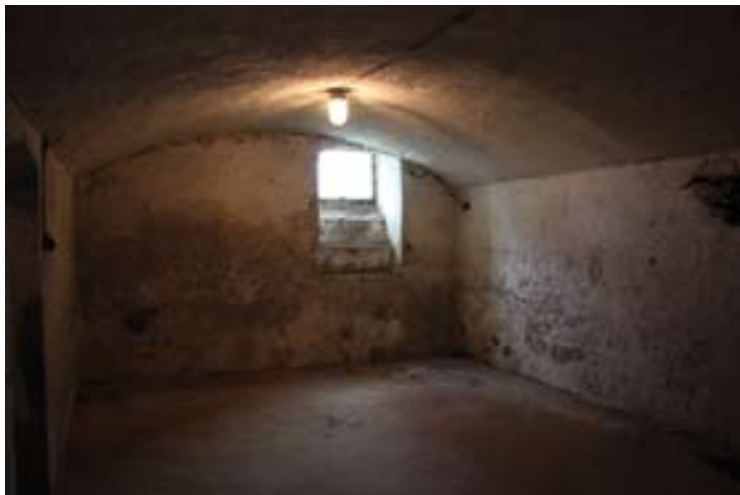
↑ Obec Neděliště - Středisko pro volnočasové aktivity (Místnost určená k výstavbě posilovny).