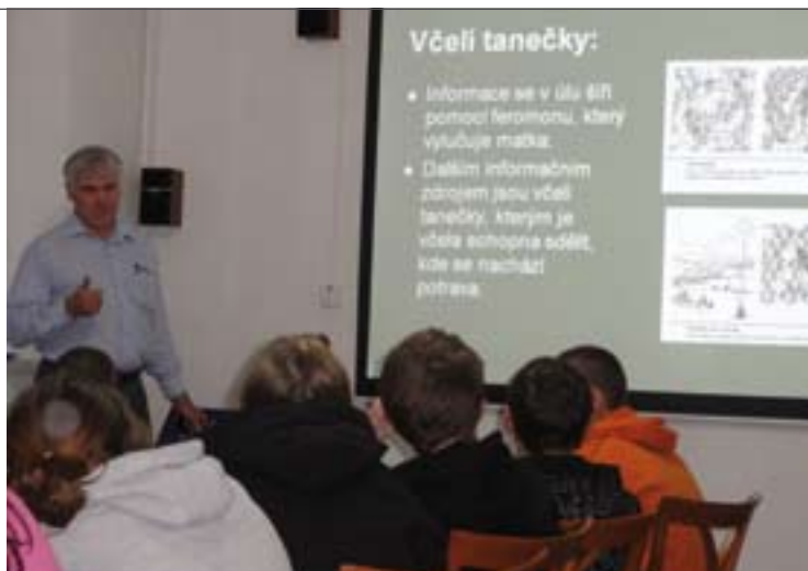
↑ Přednáška v dětském domově v Nechanicích

Cílem projektu je zapojit členy MAS do dění v regionu a podpořit rozvoj nových partnerství mezi členy. Do projektu se zapojili členové, kteří sdružují seniory a děti např. Rodinné a mateřské centrum Lhota pod Libčany o.s., Mateřské centrum Nechanice o.s., Svaz důchodců Hoříněves a další. Společně jsme připravili řadu programů a společných tvoření. Jedno z těchto setkání se konalo v adventním čase - 2. prosince 2010 v dětském domově v Nechanicích. Ve spolupráci s Českým svazem včelařů, místní organizací Nechanice byla připravena přednáška učitele včelařství. Přednáška byla určena nejen dětem, ale i široké veřejnosti. Pro menší děti jsme nachystali vánoční dílnu a soutěž, do které místní včelaři věnovali dětem z dětského domova med.