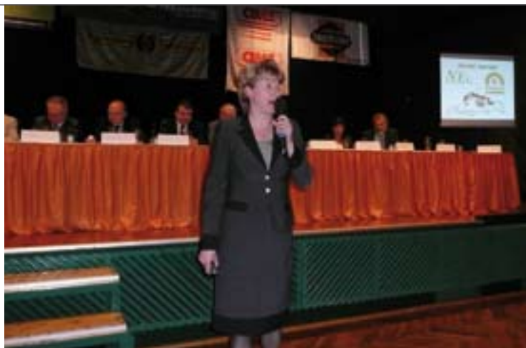
↑ Presentace činnosti MAS na Ekonomickém, marketingovém a obchodním fóru v Pardubicích.

Za zmínku stojí hodnocení všech 112 místních akčních skupin ČR, které proběhlo v létě 2010. Hradecký venkov si dle hodnotitelů vede velmi dobře a naše MAS byla zařazena do kategorie „A“ nejlépe hodnocených místních akčních skupin v ČR. Hodnocení prováděli zástupci Ministerstva zemědělství ČR, Státního zemědělského intervenčního fondu a Národní sítě MAS ČR. Hodnocení se zúčastnili jako pozorovatelé také zástupci našeho Krajského úřadu. Výsledek se zatím neprojeví ve výpočtu alokací a měl by spíše sloužit jako vodítko pro další činnost. Pro nás je tato zkušenost velmi cenná, a to především proto, že v roce 2011 již další hodnocení ovlivní i finanční rozpočet MAS. Věřím, že i letos budou výsledky činnosti natolik pozitivní, že hodnocení bude stejně výborné jako v loňském roce, a díky tomu bude možné realizovat více projektů našich četných žadatelů.