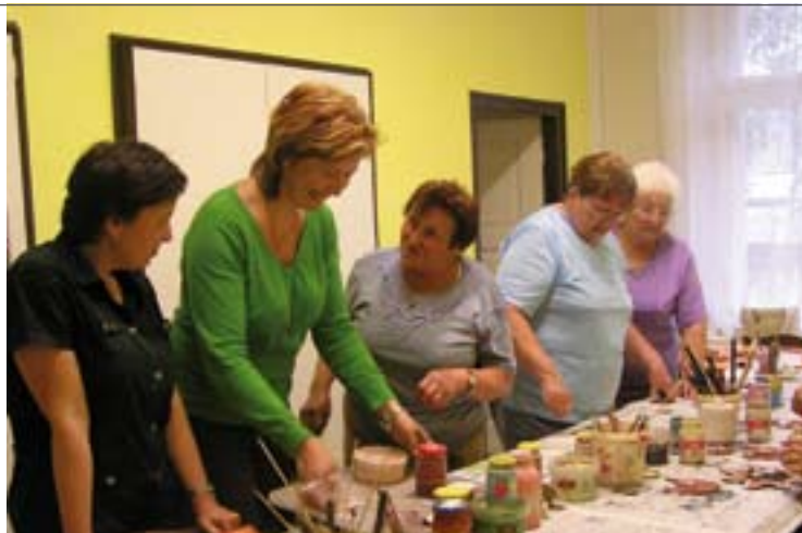
↑ Keramická dílna v Roudnici

„Venkovská kultura pro seniory a tělesně postižené“ ... je název projektu Společnosti Hradecký venkov podpořený ministerstvem kultury. Projekt jsme připravili pro seniory a zdravotně znevýhodněné občany z regionu. Na různých místech regionu se konaly kurzy zaměřené na lidové tradice a řemesla. V Roudnici, kde je na obecním úřadě vybavená učebna i s pecí, to byly keramické dílny. Náplní dalších kurzů konaných v Třesovicích, Nechanicích, Mokrovousích a Hoříněvsi, byla například práce se skleněnými korálky, tisk na plátno, malba na hedvábí či pletení z pedigu.